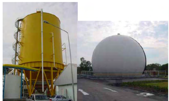
รูปที่ 2 ถังย่อยสลายแบบไม่ใช้ออกซิเจน และถังเก็บก๊าซชีวภาพ [2]

ขยะชุมชนที่จะเข้าสู่ขบวนการกำจัดขยะโดยวิธีการย่อยสลายแบบไม่ใช้ออกซิเจนนี้จะต้องเข้าสู่ขบวนการคัดแยกขยะก่อน โดยคัดแยกเฉพาะขยะมูลฝอยอินทรีย์ และทำการลดขนาดโดยการบดตัดให้มีขนาดเหมาะสมพอที่จะส่งเข้าถังย่อยสลาย ซึ่งเป็นระบบปิดเพื่อให้ขยะอินทรีย์เกิดการย่อยสลาย โดยจุลินทรีย์ในสภาพที่ไร้ออกซิเจน ผลพลอยได้จากการย่อยสลายจะเกิดก๊าซชีวภาพ ซึ่งมีก๊าซมีเทนเป็นองค์ประกอบประมาณ 50% และก๊าซชีวภาพนี้จะนำไปเป็นเชื้อเพลิงให้เครื่องยนต์ก๊าซ (Gas Engine) ในการผลิตไฟฟ้าต่อไป โดยมีประสิทธิภาพพลังงานไฟฟ้าต่อตันขยะประมาณ 75-150 kWh/ton [2] ลักษณะของถังย่อยสลายแบบไม่ใช้ออกซิเจนและถังเก็บก๊าซชีวภาพ แสดงในรูปที่ 2