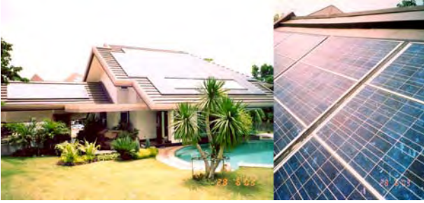
รูปที่ 2 ระบบผลิตไฟฟ้าจากเซลล์แสงอาทิตย์บนหลังคาบ้าน